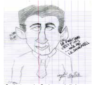
Caricature de Sarkozy réalisée par un élève de 3e.

Nous montrerons que le dessinateur de presse est souvent beaucoup plus « libre » dans son expression que le rédacteur qu'il accompagne sur une même page.